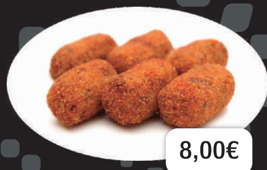
NUGGETS DE POLLASTRE - NUGGETS DE POLLO - CHICKEN NUGGETS - HÄHNCHEN NUGGETS - NUGGETS DE POULET