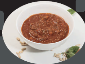
SALSA BOLONYESA - BOLOÑESA - BOLOGNESE - BOLOGNESE - BOLOGNAISE